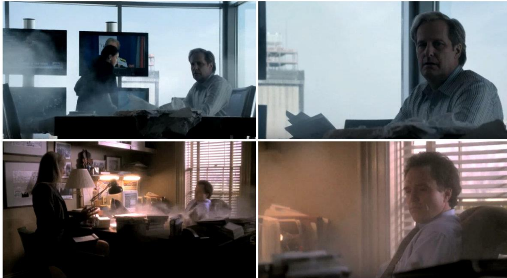
Figuras 7 e 8 (sentido horário): Will McAvoy em seu apartamento em The Newsroom . Figuras 9 e 10: Josh Lyman em seu escritório em The West Wing .

Além dos diálogos, Sorkin também inclui em seus roteiros repetições que envolvem as construções das cenas, e se apresentam de forma visual, sem uma relação direta com a trama, como nos episódios de The Newsroom e The West Wing que uma parte do teto cai em cima da mesa enquanto os personagens trabalham e nos episódios de Sports Night e The West Wing em que vidros são quebrados acidentalmente e personagens se assustam: