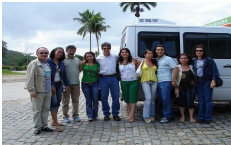
Doutorandos em Educação Popular, presentes na Usina Catende – PE. EXTELAR (2006)

vigentes geradas de manifestações que possam ser justificadas, pois do contrário não serão legítimas nem terão valor dialógico intersubjetivo. É, enfim, um fenômeno educativo pautado por uma pedagogia (metodologia) incentivadora da participação e do empoderamento das pessoas, com conteúdos e técnicas de avaliação processuais. Esse fenômeno é lastreado em uma teoria política direcionada aos anseios humanos de liberdade, de justiça, de igualdade e felicidade, além de estimuladora das transformações sociais necessárias.