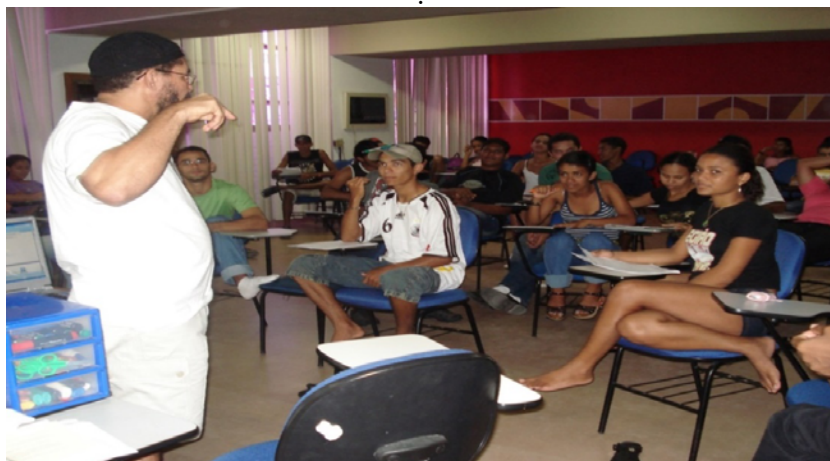
Curso de pesquisa-ação em empreendimentos solidários na INCUBES/NUPLAR (2007)

Essa dimensão da extensão possibilita a superação da alienação gerada pela não posse do produto do trabalho por parte de seus produtores, no modo de produção capitalista. Todos os produtores devem apropriar-se desse produto do trabalho, que é o saber: