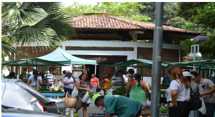
Projeto em Feira Agroecologia na INCUBES/NUPLAR (2008)

Esse direcionamento conceitual – extensão como trabalho social útil – é manifestado nos projetos analisados 30 . Convém ressaltar que os indicadores, em torno desta perspectiva, apresentaram percentuais elevados nos projetos CERESAT e Escola Zé Peão, particularmente entre os executores, com percentuais de 63% e 61%, respectivamente. Entre os coordenadores do Projeto Praia de Campina, atinge-se o percentual de 47% e 13% entre os executores. No Projeto Qualidade de Vida, essa concepção expressa-se entre os coordenadores com 13%, considerado, ainda um índice representativo.