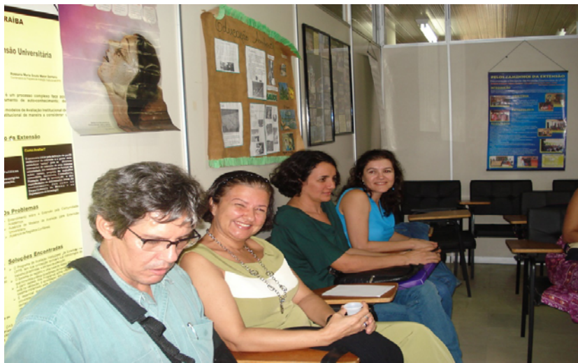
Pesquisa no Grupo EXTELAR/NUPLAR (2008)

Com o conceito de extensão considerado, a partir de agora, como um trabalho social útil, sua intencionalidade adquire um duplo viés: incrementar a indissociabilidade ensino e pesquisa e anunciar mudanças que venham combater a alienação. Dessa forma, a extensão constitui-se como um traço universal de todo o movimento, em que a sociedade, ao mesmo tempo que produz o homem, é produzida por ele. Na extensão, as outras atividades da universidade (o ensino e a pesquisa) são redimensionadas nessas bases. Trata-se de um trabalho que produz conhecimento e, também, o humano como indivíduo, bem como, os demais humanos.