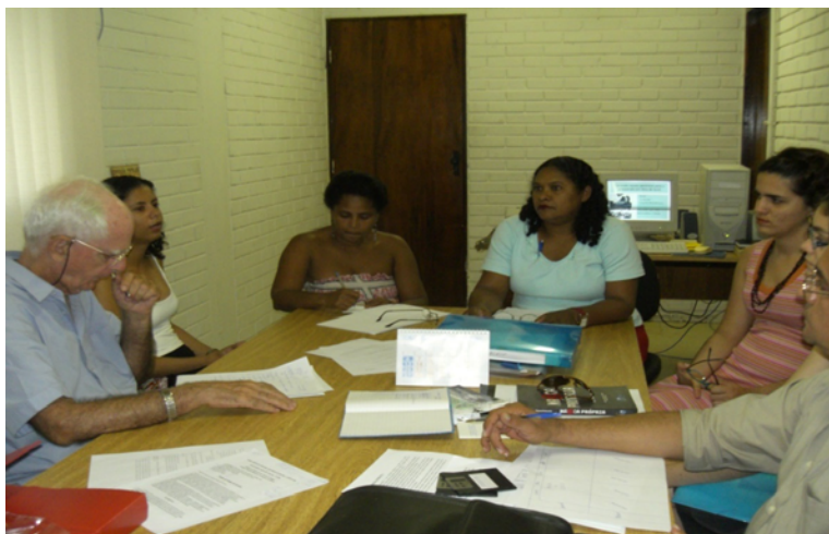
Atividades de pesquisa em projeto da INCUBES/NUPLAR (2006)

O que segue são trechos sintéticos e mais diretos aos conceitos das temáticas em evidência, já divulgados sobretudo em livro e artigos de revistas especializadas, podendo, inclusive, serem vistos isoladamente e fora deste texto.