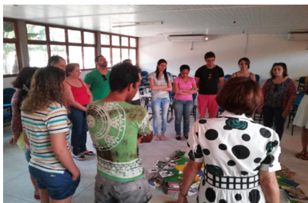
Curso de Especialização em Extensão e Economia Solidária (NUPLAR - 2016)

Na busca da modernidade, as ações educativas presentes na extensão popular voltam-se para uma ética dos fins e dos meios, resgatando-se a ética na política. Neste sentido é que se pode desenvolver o trabalho social voltado ao exercício da democratização de todos os setores da vida social, com a promoção da participação de todos os envolvidos em extensão, incentivando, inclusive, a educação aos direitos emergentes das pessoas.