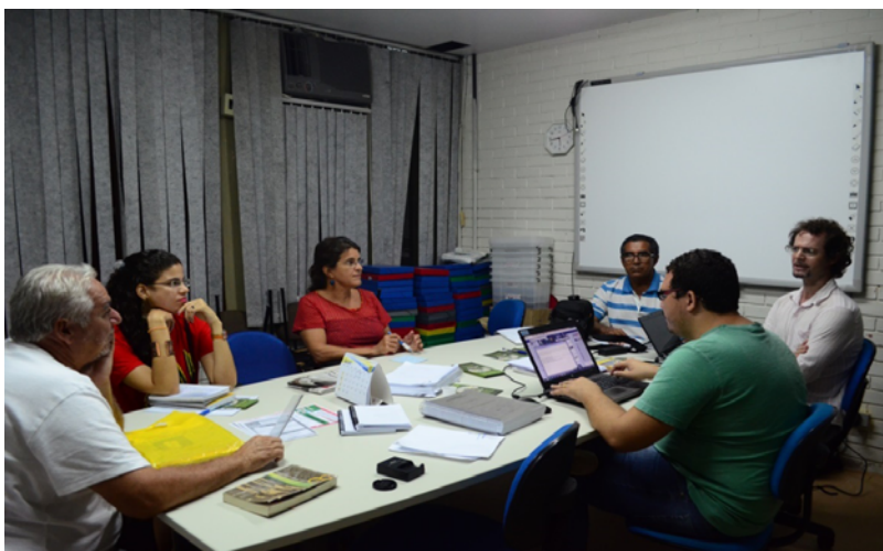
Preparando edição de livro com várias mãos – EXTELAR/NUPLAR (2016)

A Universidade Popular será uma instituição sem “sustos” com o novo século. Funda-se como uma aventura humana, conforme expressão de Cristóvão Buarque (1994), presente na odisseia da humanidade em sua existência. Assume expectativas do movimento docente nacional. Será uma universidade pública, gratuita, de qualidade socialmente referenciada. Será autônoma para poder desenvolver as mais diferenciadas pesquisas, democrática em suas relações internas e nas escolhas de dirigentes; será laica para garantir de que as diferentes religiões possam, inclusive, estar representadas nesse mundo escolar, desde que não queiram impor os seus credos religiosos. Será uma universidade crítica para garantir que o conhecimento não se torne mera repetição daquilo que se estabeleceu. Por tudo isso, será uma universidade popular por ser capaz de contribuir, com princípios éticos, para o desenvolvimento humano em bases tidas como populares.