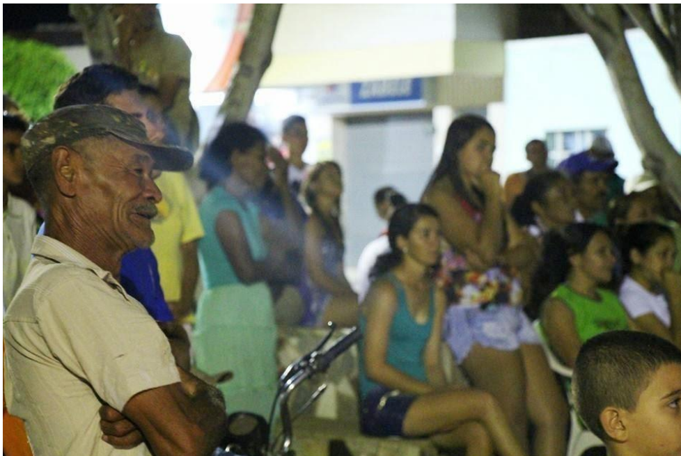
Figura 19 - Pracine/ Zabelê – Cinema na Praça 2