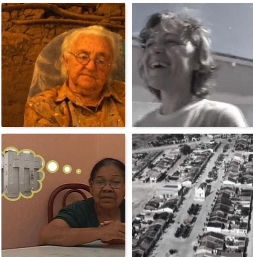
Figura 16 - Frames retirados do documentário Na Memória do Meus Avós: Uma História (2010)

preservação e resgate da cultura, como o projeto: Na Memória dos Meus Avós: Uma História e Na memória do Meus Avós: Outras Histórias . Ademais, pôde pôr em prática iniciativas criativas quemescravam mais de uma linguagem artística Novos Palcos e Plateias 31 e Cantando para o Eterno 32 .