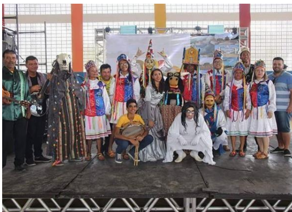
Figura 7 - Reisado de Zabelê. Zabelê /Paraíba

Os principais personagens do grupo de Reisado de Zabelê são: o Mestre, o Contramestre, os Embaixadores, o Rei e a Rainha, os Mateus, a Alma, a Burrinha, o Boi, o Jaraguar e os Figurás. Atualmente o grupo é acompanhado por uma banda (Voz, Sanfona, Zabumba, Pandeiro, Tarol e Cavaquinho), além de continuar contando com a produção dos membros da ASCUZA e da Secretaria de Cultura do Município.