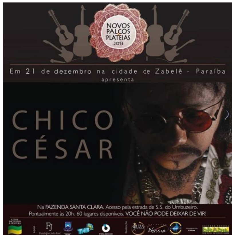
Figura 13 - Cartaz de divulgação da última edição do NPP. Zabelê /Paraíba

documentários, intitulados Na Memória dos Meus Avôs e Um e Outras Histórias 28 , foram lançados no ano de 2011, no dia do aniversário da cidade. Vale destacar que a sua confecção foi motivada pela ausência de material em vídeo que documentasse e narrasse a história do município, contribuindo, dessa forma, com o aprendizado acerca da cultura local. Tais produções foram muito bem recebidas pelos moradores do município, como também ocupa um lugar especial entre as produções desenvolvidas pela ASCUZA. Estes dois documentários serão melhores analisados no quinto capítulo deste trabalho, em que também será levantada sua significância no campo da educação.