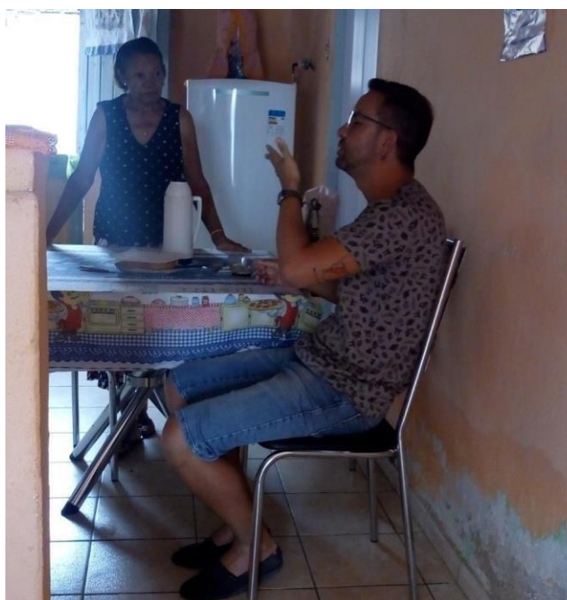
Figura 31 - Intervalo de gravação de um novo documentário produzido pela ASCUZA

Com isso, a cidade pôde se ver novamente envolvida em ações cinematográficas. Mais uma vez os moradores, literalmente, abriram suas portas para o cinema. Muitos se diziam saudosos de se verem envolvidos em produções como aquelas, trazendo à tona para o desenvolvedor desta pesquisa de alguns antigos membros do Coletivo as lembranças de muitas outras produções.