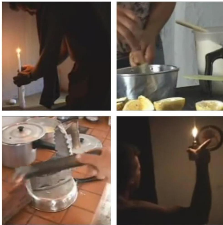
Figura 14 - Frames retirados do documentário O Escuro (2005)

Por meio da atuação do Atissar e de suas produções culturais, a cidade de Zabelê ganhou notoriedade nacional. Suas produções audiovisuais abordam desde as problemáticas da região ( Rapadura é doce, mas não é mole / O escuro 29 ) até a promoção da cultura local ( Pega de Boi / Reisado de Zabelê 30 ).