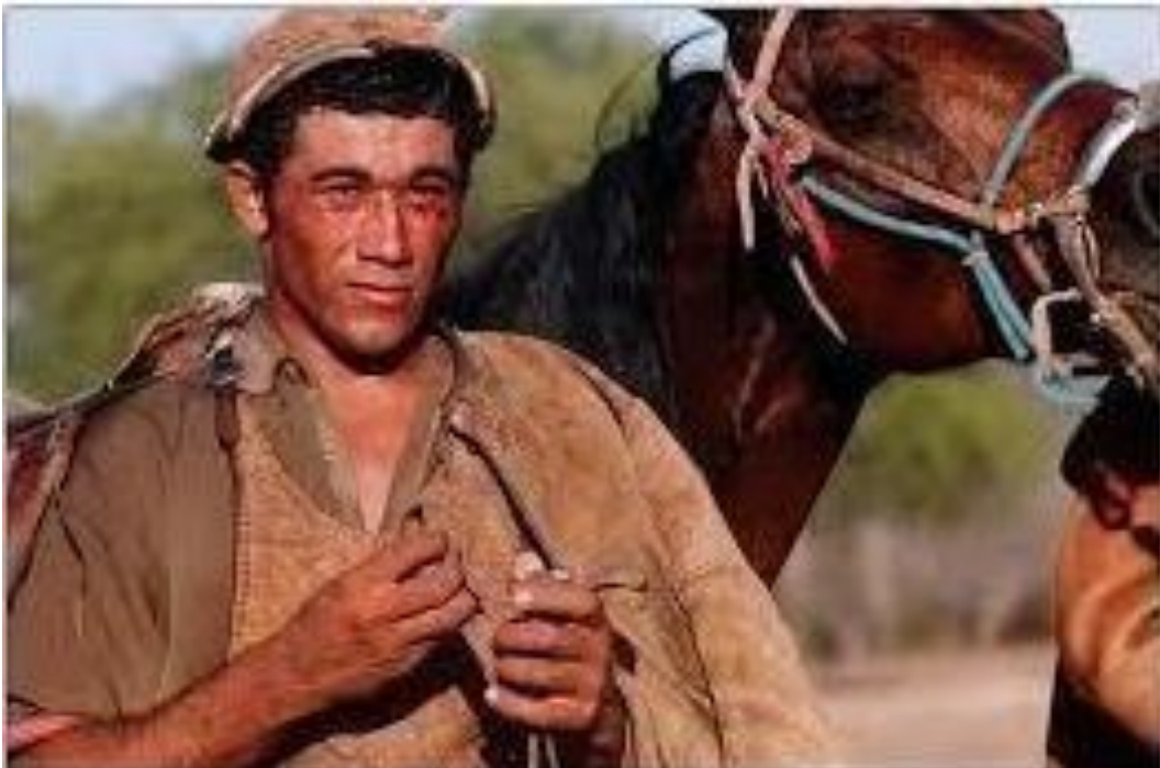
Figura 11 - Pega de Boi. Zabelê 3/Paraíba