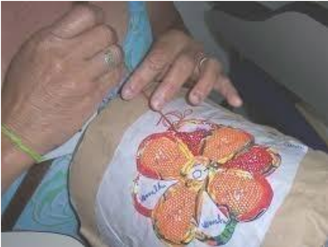
Figura 4 - Processo de feitura da Renda Renascença. Zabelê/Paraíba

No estado da Paraíba a cultura da Renda Renascença é mais forte na região do Cariri, mais especificamente nas cidades de Zabelê, Monteiro, Camalaú, São Sebastião de Umbuzeiro e São João do Tigre. Pela complexidade e tamanha beleza dessa atividade houve uma maior atenção para que essa cultura não se extinguisse e fosse repassada para um maior número de artesãs.