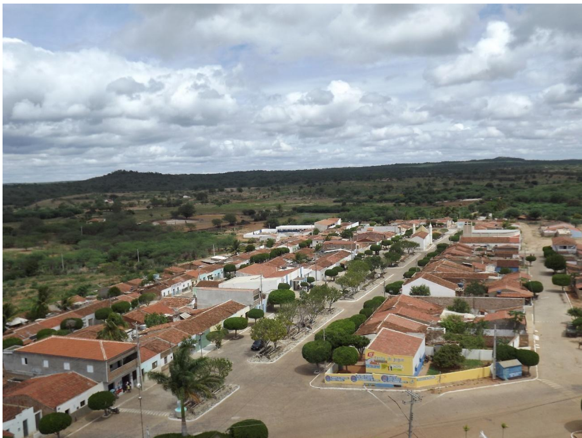
Figura 1 - Imagem aérea do município de Zabelê

Fonte: Prefeitura Municipal de Zabelê - PB. Ano 2019.