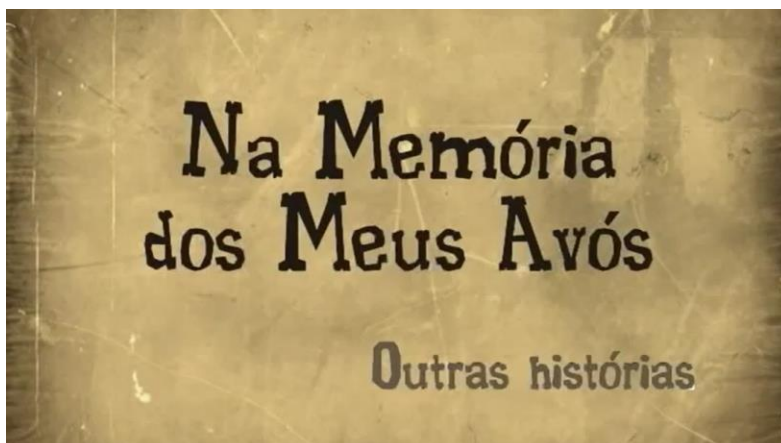
Figura 25 - Cartela com o título de abertura do segundo filme