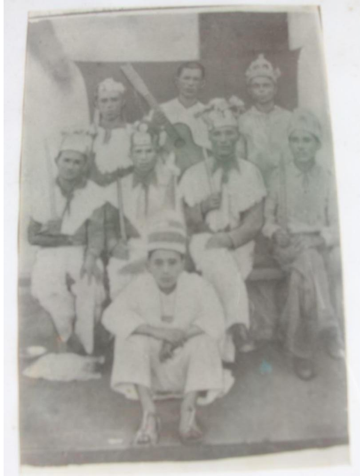
Figura 6 - Registro da formação mais antiga do grupo de Reisado de Zabelê. Zabelê /Paraíba