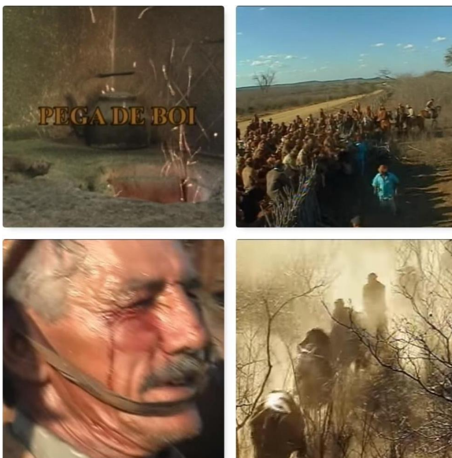
Figura 15 - Frames retirados do documentário Pega de Boi (2006)

Daí em diante, o Coletivo se preocupou em sempre manter seus membros capacitados para registrar as expressões artísticas da região, como também desenvolverem roteiros que tivessem relevâncias artísticas e sociais.