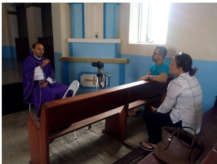
Figura 33 - Gravação com o atual pároco de Zabelê

O novo projeto que nasce a partir do retorno do pesquisador ao município de Zabelê e de suas novas construções sociais naquela localidade, mais uma vez e de maneira não proposital, trabalha com a valorização de narrativas orais, por meio do resgate das memórias dos habitantes mais antigos da cidade. Nessa nova produção em desenvolvimento, o tema do filme está atrelado à história religiosa do município, e gira em torno da construção da primeira igreja de Zabelê, marcada por muitos causos e curiosidades.