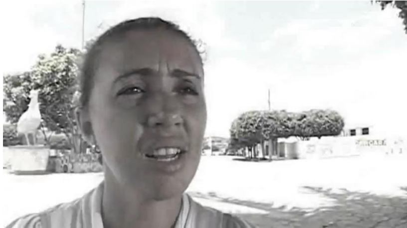
Fonte: Frame do filme Na Memória dos Meus Avós . 2020

A sensação explorada por imagens acinzentadas transmitem naturalmente seriedade, sobriedade ou, até mesmo, imparcialidade. A cor cinza permanece numa espécie de “limbo” das cores, um meio termo. Segundo psicólogos e pesquisadores em comunicação: