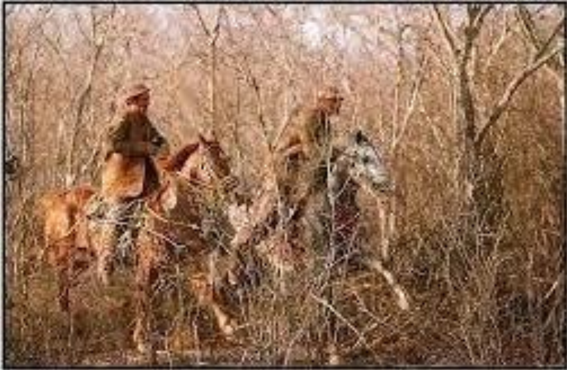
Figura 10 - Pega de Boi. Zabelê 2/Paraíba