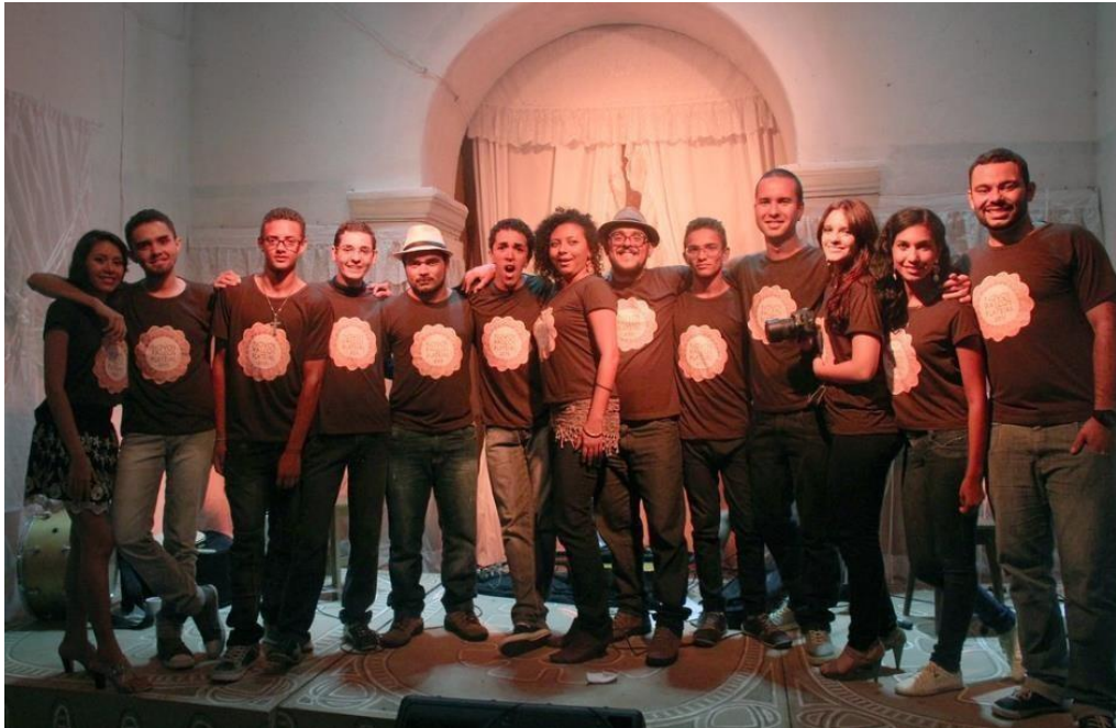
Figura 12 - Última formação do Coletivo Atissar. Zabelê/Paraíba