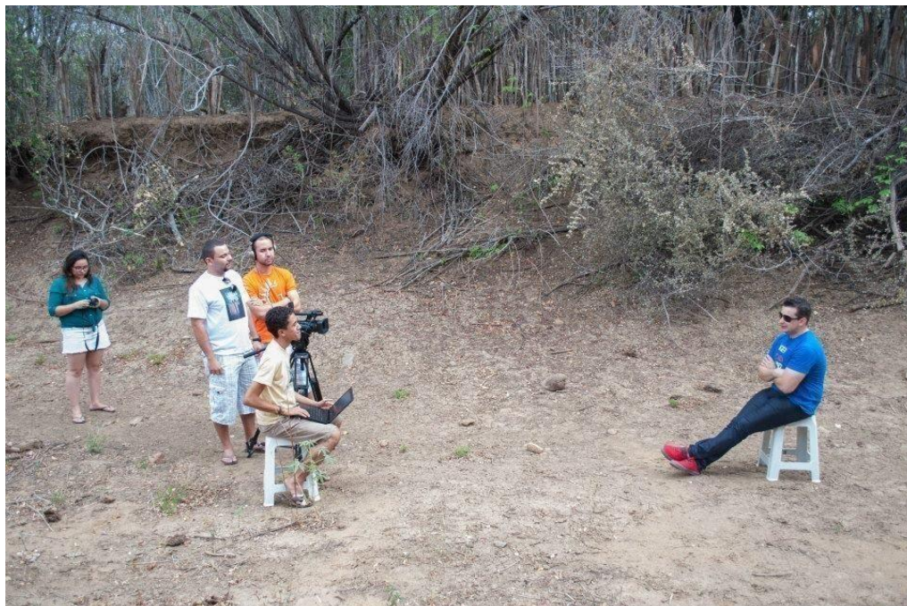
Figura 21 - Processo de gravação dentro do Projeto Novos Palcos e Plateias/Zabelê -PB