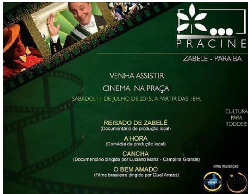
Figura 20 - Cartaz digital do Pracine/ Zabelê – Cinema na Praça