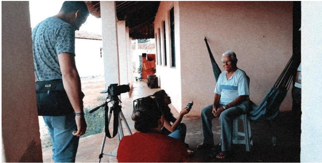
Figura 32 - Gravação de um depoimento para o documentário que narra a história da primeira igreja do município