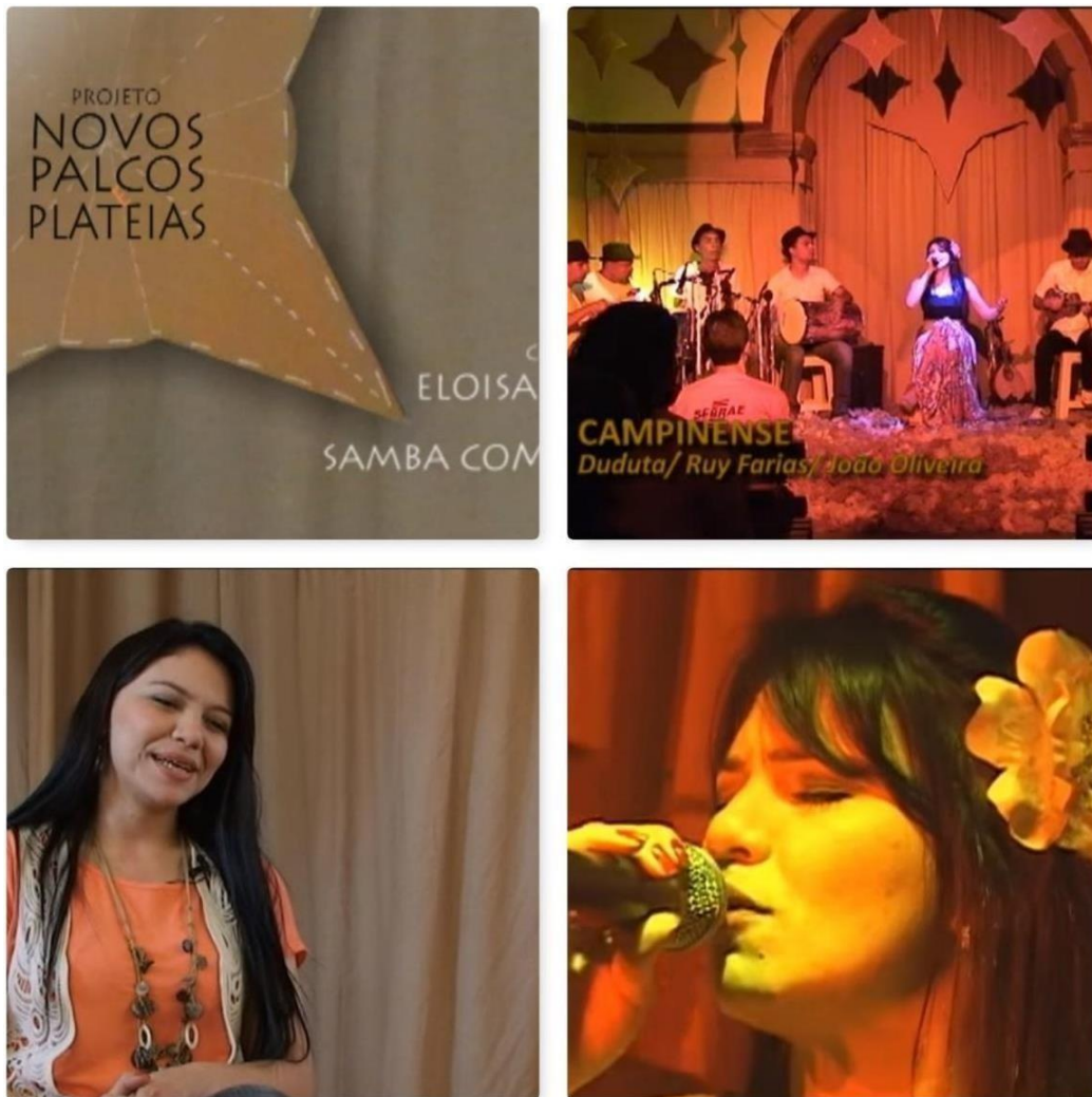
Figura 17 - Frames retirados do DVD: Novos Palcos e Plateias (2013)