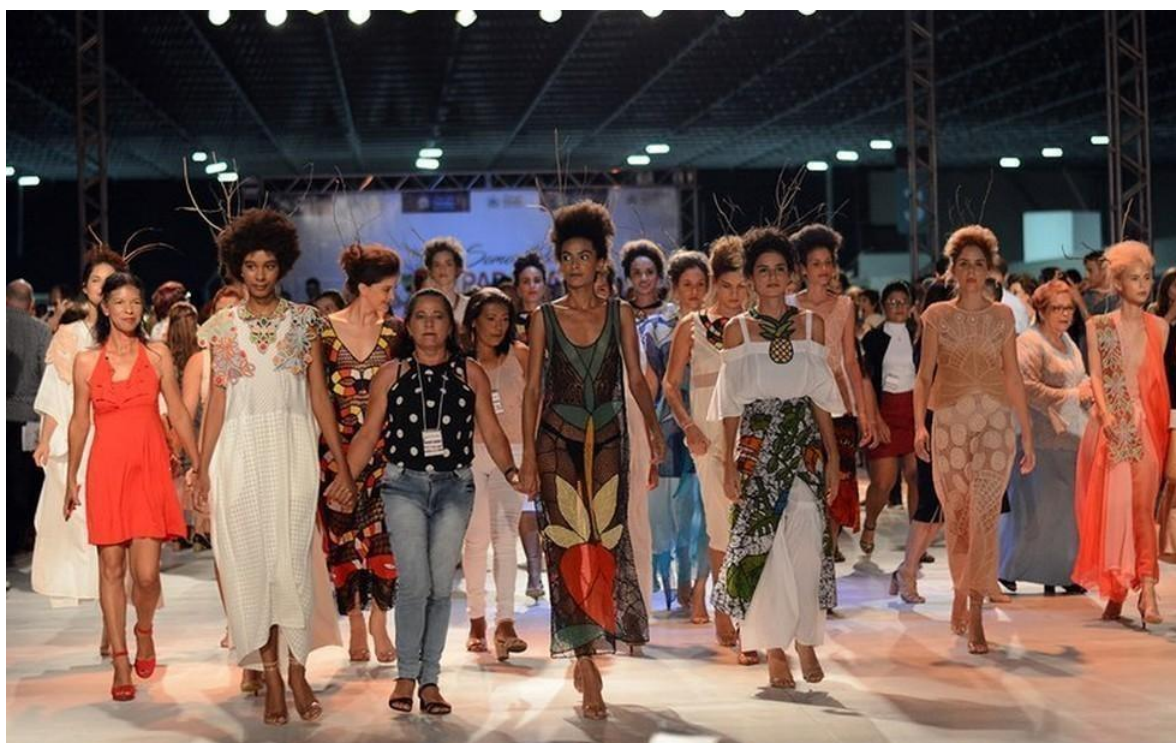
Desfile da Coleção #SomosTODOSParaíba. 2020