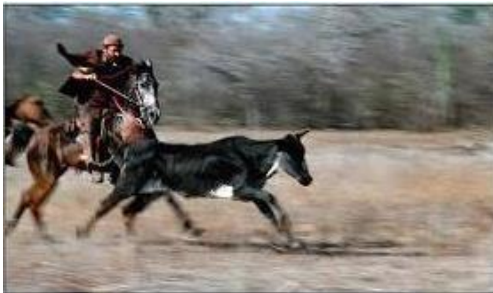
Figura 9 - Pega de Boi. Zabelê 1/Paraíba

“fujão” reunia em sua propriedade alguns vaqueiros da região, que, em forma de mutirão, se embrenhavam na mata para resgatar o gado arisco. Em troca, era oferecido um farto churrasco regado a bastante cachaça.