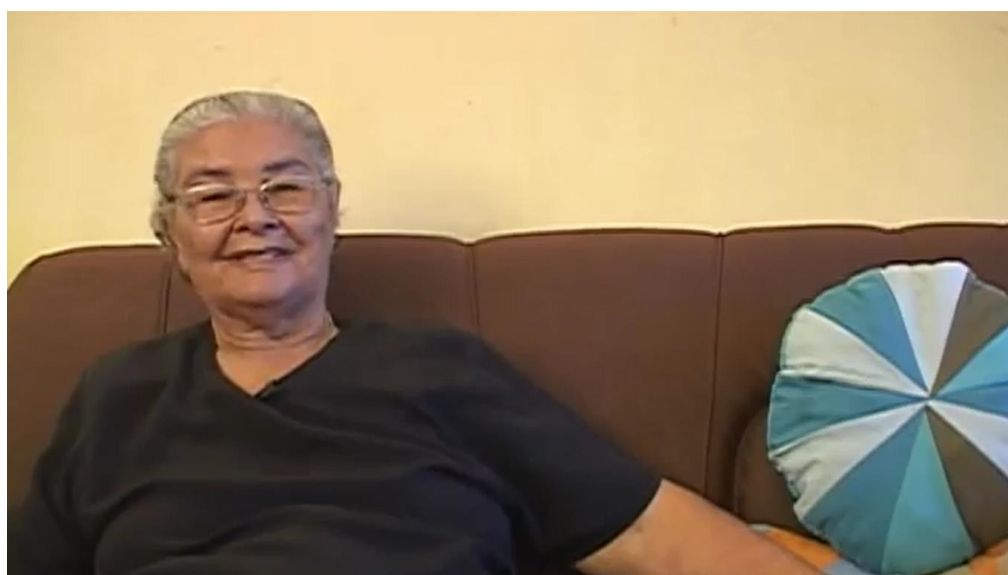
Frame do filme Na Memória dos Meus Avós .2020

E essa sensação de passado também pode ser percebida nas locações onde foram gravados os depoimentos nas casas e nos ambientes reais nas quais os entrevistados residiam na época da gravação. E essa veracidade refletida na composição e nos enquadramentos das imagens, nos figurinos e nos objetos de cena, despertam outro sentimento referente às variações da tonalidade de marrom, como a segurança e o aconchego. Bem como afirma a socióloga e psicóloga Eva Heller: