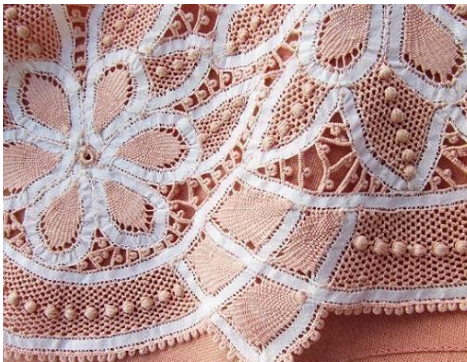
Figura 3 - Peça de Renda Renascença. Zabelê/Paraíba

Dentre as atividades principais que representam o patrimônio cultural material da cidade, podemos destacar a Renda Renascença 19 . A produção desse tipo de artesanato é composta, em sua grande maioria, por mulheres que herdaram esse conhecimento de suas ancestrais: mães, tias, avós.