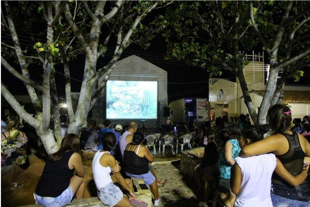
Figura 18 - Pracine/Zabelê – Cinema na Praça