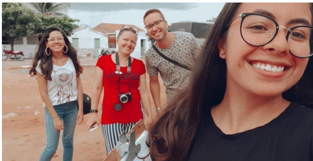
Figura 34 - Parte da nova equipe atuante no eixo audiovisual de Zabelê

Mais uma vez o cinema pôde proporcionar à cidade de Zabelê a valorização e preservação desua história e cultura. Promovendo um novo diálogo entre a arte, cinema e educação, por meio de novas oficinas de capacitação, envolvendo o universo cinematográfico, e utilizando a linguagem do cinema documental como um aporte para o registro da memória dessa localidade. Além disso, apresentando um novo tipo de cinema para admiradores dessa linguagem e conquistando novos adeptos entusiastas em trabalhar e atuar no meio audiovisual.