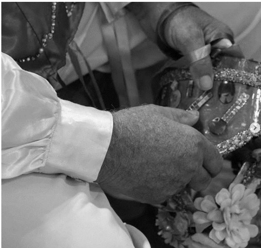
Figura 22 - Idoso participante do Grupo de Reisado de Zabelê / Zabelê - PB